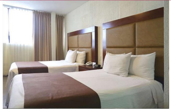
Habitación Estándar Doble