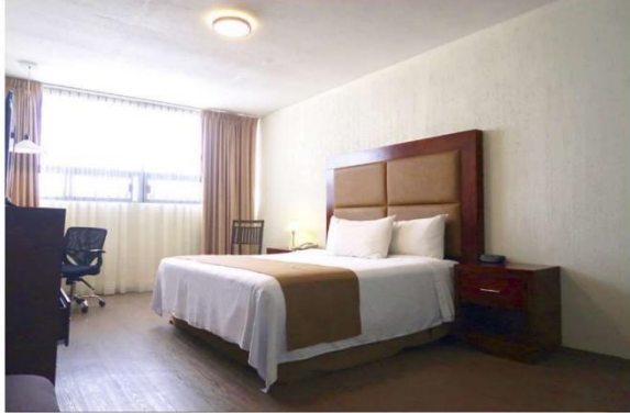
Habitación Estándar Sencilla